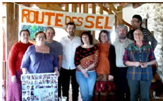
L'équipe animatrice de la RdSEL

Amis Route-des-SEListes, sachez que lorsque vous avez "l'honneur" ☺ d'être agréés officiellement "bénévole", vous appartenez également à la liste de diffusion du CA et là, oh surprise, je me suis retrouvée littéralement noyée sous les emails ! Impossible de tout lire, surtout lorsqu'on ne comprend pas tous les aboutissants. Beaucoup de considérations se sont alors bousculées dans mon esprit. Tout d'abord : « Quel travail ! Quel altruisme ! » Moi qui estimais le temps dévolu à la tâche qui m'incombait déjà très conséquent, c'était une brouille au regard de celui concédé par les membres du CA ! Puis, assez vite : « Vais-je réussir à assumer sur le long terme ? » Et enfin, une prise de conscience, la meilleure, celle qui m'a fait aborder ce premier CA sereinement et sans appréhension : j'avais en face de moi des personnes partageant des valeurs essentielles pour moi. Ce n'est pas si fréquent si on y réfléchit sérieusement.